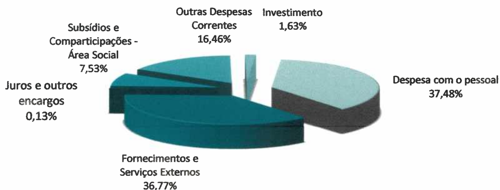
Gráfico 1: Estrutura do Orçamento de Despesa para 2019

À semelhança do executado nos anos transatos, os encargos com fornecimentos de bens e aquisição de serviços – entre os quais se contam os incluídos no apoio social para acesso à saúde nos regimes “Convencionado”, “Livre” e “Medicamentos” – apresentam um total consolidado de grande importância no contexto do conjunto da despesa, fixando-se no Orçamento para o período em referência em 3.237.586 euros.